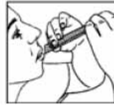
Llevar a la boca presionar y extraer

Si los síntomas empeoran o persisten después de 7 días debe consultar a su médico.